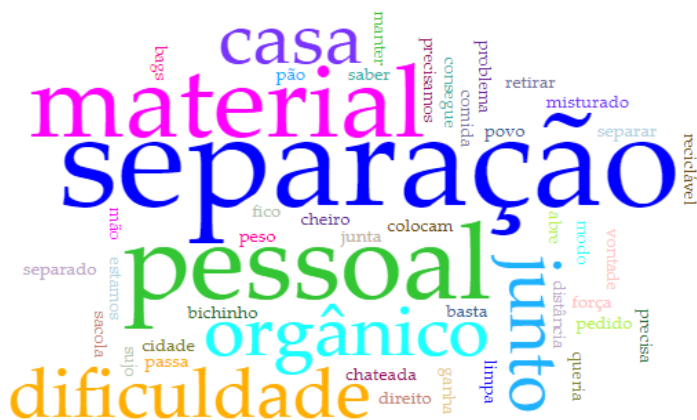
Figura 1: Nuvem de palavras mais frequentes em relação às dificuldades encontradas pelos Catadores de Materiais Recicláveis da AAA-SH.

Ao perguntarmos “qual a maior dificuldade que você encontra em seu trabalho?”, podemos observar, a partir das respostas (figura 1), o quanto é precário o conhecimento da população referente à EA, aos cuidados com o descarte dos RSR para não prejudicar o ambiente, às ações necessárias para diminuir os impactos ambientais e trazer esperanças em relação à sustentabilidade ou meios sustentáveis – visto que as pessoas colaboram para o aumento desses impactos com suas ações irregulares. As respostas também revelam uma certa despreocupação com o próximo ou, talvez por falta de conhecimento de alguns, em relação ao trabalho que os Catadores realizam; e que se não o fizessem, poderíamos estar vivendo em meio ao lixo que nós mesmos produzimos.