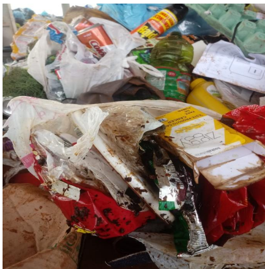
Figura 3: Resíduos Sólidos Orgânicos encontrados dentro das embalagens de Resíduos Sólidos Recicláveis.

Ao observarmos a Figura 3, é possível perceber o descaso com esses Catadores. Passam pelas suas mãos tantos tipos de materiais e muitos com diversos tipos de micro-organismos e insetos devido à sujeira. São situações que poderiam ser evitadas se as pessoas fizessem uma simples higiene em alguns materiais antes do descarte. Citamos como exemplo uma caixa de leite que, em poucos dias, se descartada sem uma prévia higienização, pode gerar a proliferação de fungos e bactérias e, ainda, o mau cheiro citado pelos Catadores.