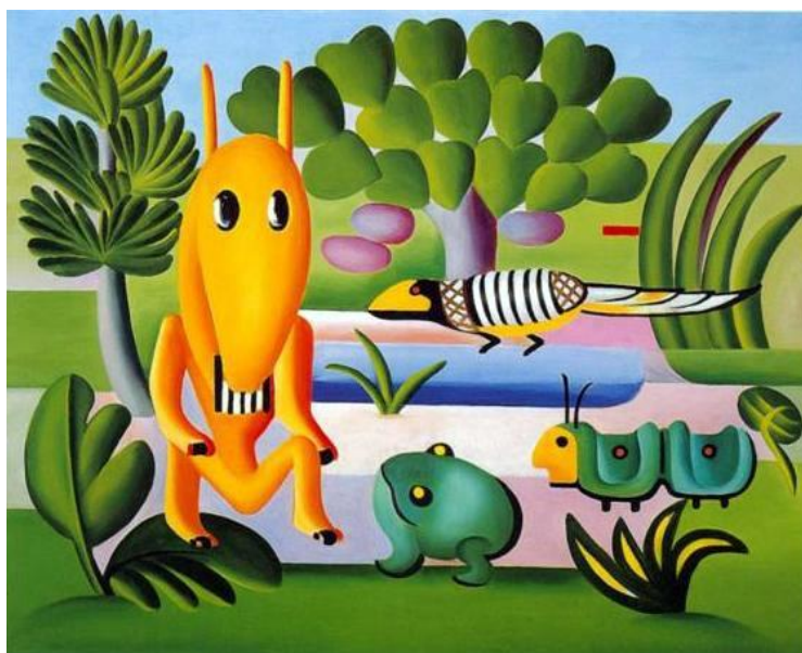
Tarsila do Amaral: Cuca

http://forumearebea.org/category/vi-forum/