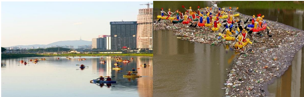
Figura 4: Fotografias de instalações referentes à obra Caiaques , do artista plástico paulistano Eduardo Srur.

O aperfeiçoamento das propostas do artista o levou a focar sua produção num tripé erigido por questões éticas, ambientais e arquitetônicas, o moveu a um agenciamento singular que caracteriza a obra Caiaques (Figura 4). Como o artista declara numa entrevista, sua obra mantém o potencial de afecção democrático (CANTON, 2009). Nela, cento e cinquenta esculturas compostas por caiaques de plástico e remos de alumínio, manequins de plástico, roupas de tactel , parafusos e cabos de aço são lançados a certa altura do rio Pinheiros, localizado na cidade de São Paulo. Não se detendo ao caráter de fixidez exigido em PETS , os caiaques boiam e transitam conforme o devir das águas. Um efeito estético curioso está demonstrado na segunda figura, em que as esculturas se aglomeram numa “ilha” de lixo superficial, acentuando contornos que muito remetem ao mapa do Brasil, um efeito não planejado pelo autor da obra.