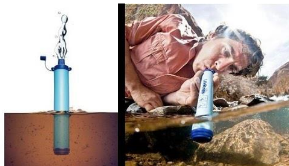
Figura 1: Purificador de água portátil LifeStraw .