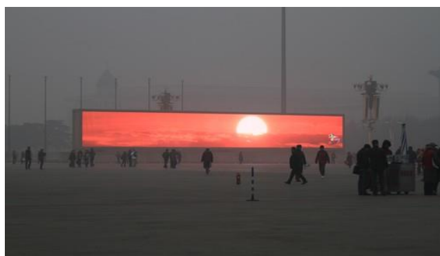
Figura 2: Nascer do sol em telas de Led em Beijing, China.

O outro caso analisado, característico das máquinas técnicas, é o da projeção de vídeo referente ao nascer do sol em telas de LED, projetado na Praça Tiananmen, em Beijing, China, durante o ano de 2014 (Figura 2). A gravação projetada se caracterizava pelo mesmo tempo de duração que o fenômeno natural acontece, não se tratando de uma decisão acionada pelo governo chinês, mas por uma companhia de turismo, dado que, no contexto, a poluição atmosférica impedia que se visse o céu da cidade. O papel do governo chinês acerca desse caso se resumiu à outra projeção, em LED posicionado próximo ao comentado anteriormente, com o seguinte slogan : “Cuidar da atmosfera é dever de todos 10 ”.