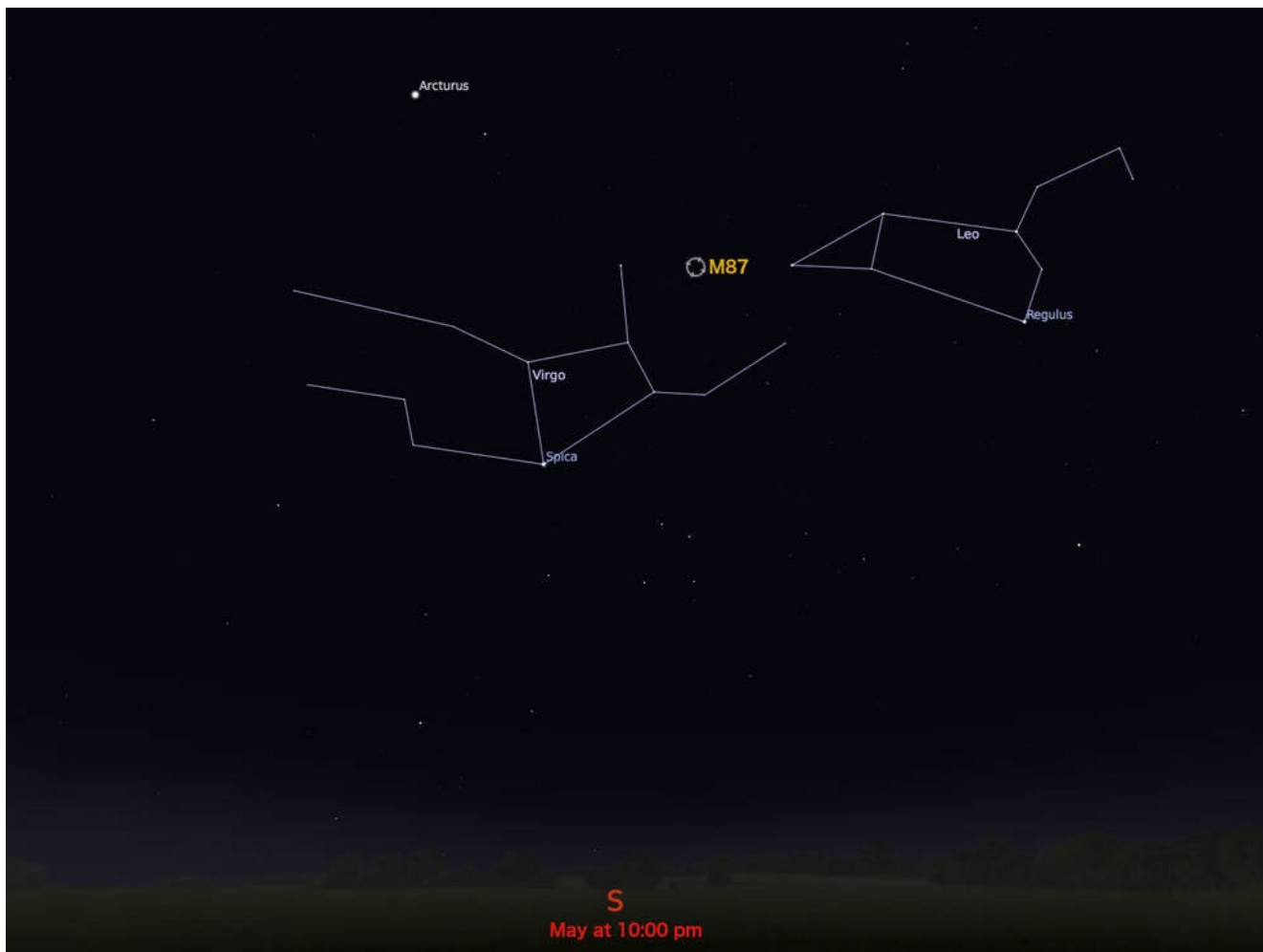
Figura 2. Imagem das constelações de Virgem (Virgo) e Leão (Leo), na página da NASA, indicando a posição da galáxia M87 (Messier 87), no centro da qual temos o buraco negro supermassivo observado pelo EHT.