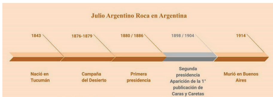
Fig. 1. Línea de tiempo. Biografía de J. A. Roca.