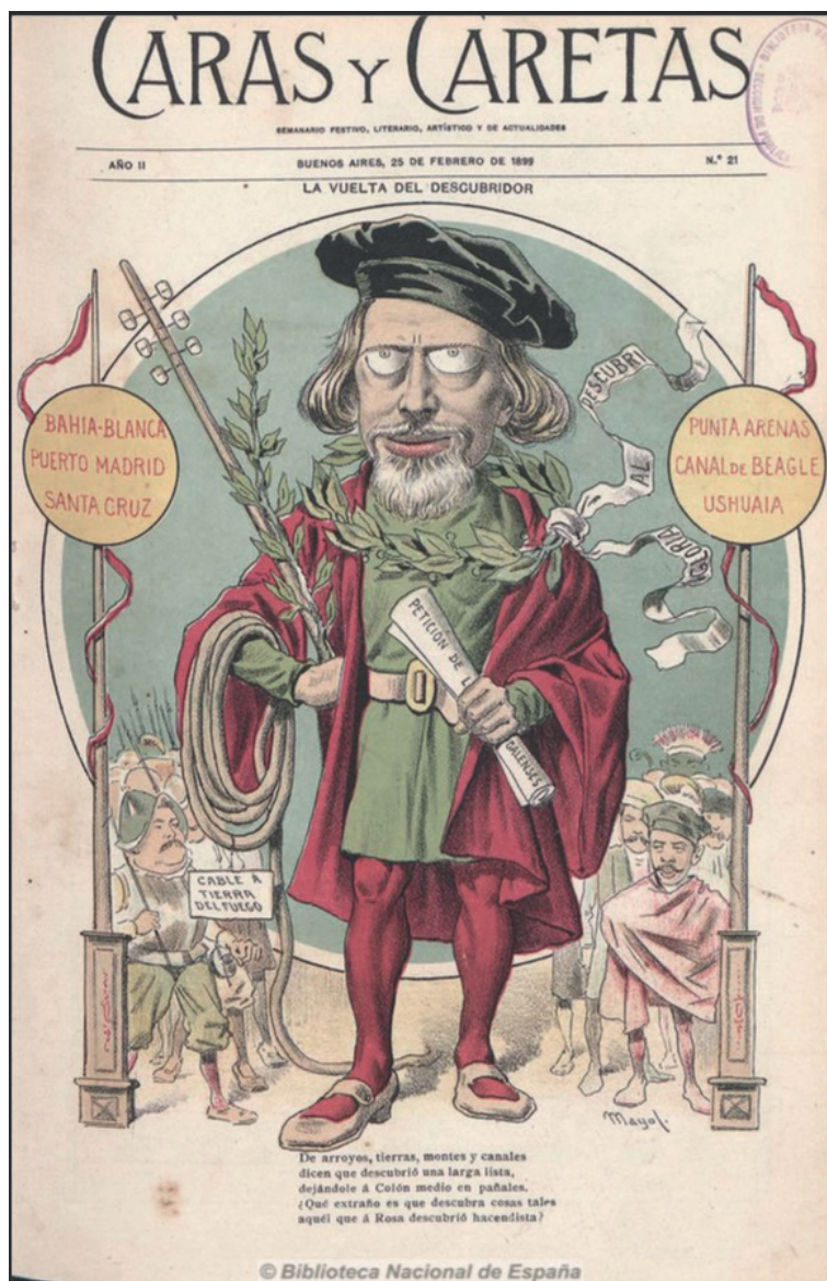
Fig. 5. Portada revista Caras y Caretas , año II, N°21. Manuel Mayol. La vuelta del descubridor , 25 de febrero de 1899