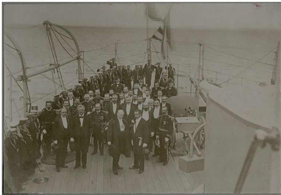
Fig. 4. Spencer y Cía. (Eduardo Clifford Spencer). Abrazo del Estrecho a bordo del acorazado O'Higgins . 1899 (15 de febrero de 1899). Fotografía blanco y negro en papel positivo monocromo, 10,8 x 15,6 cm.

Fuente: Colección Museo Histórico Nacional, Chile. Fotografía: Gentileza MHN. Donación de José Luis Coe Lyon https://www.fotografiapatrimonial.cl/Fotografia/Detalle/22837