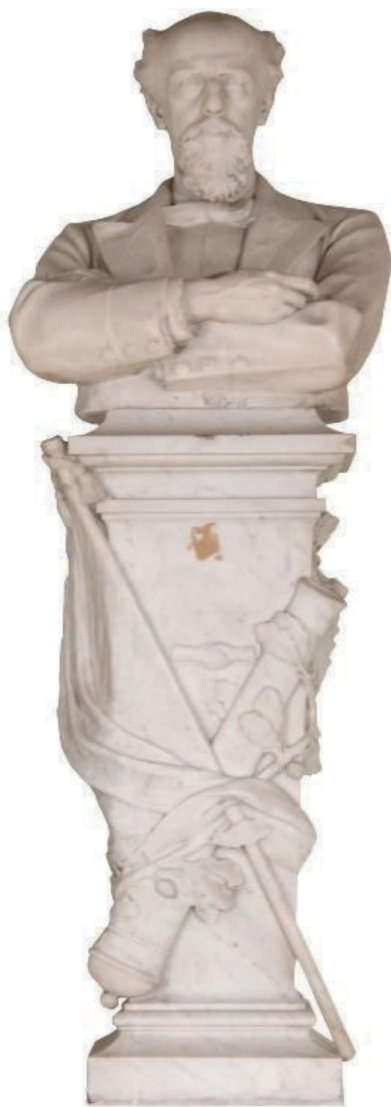
Fig. 2. Héctor (Ettore) Ximenes. Retrato del General Roca . Mármol, 74 x 59 cm.

Fuente: Colección Museo Nacional de Bellas Artes, Argentina. Fotografía: Gentileza MNBA. Archivo documental: Inventario 6565