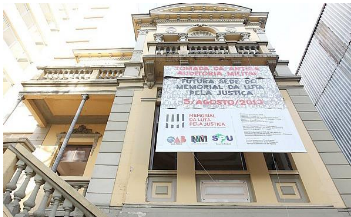
Figura 4: Memorial da Luta pela Justiça