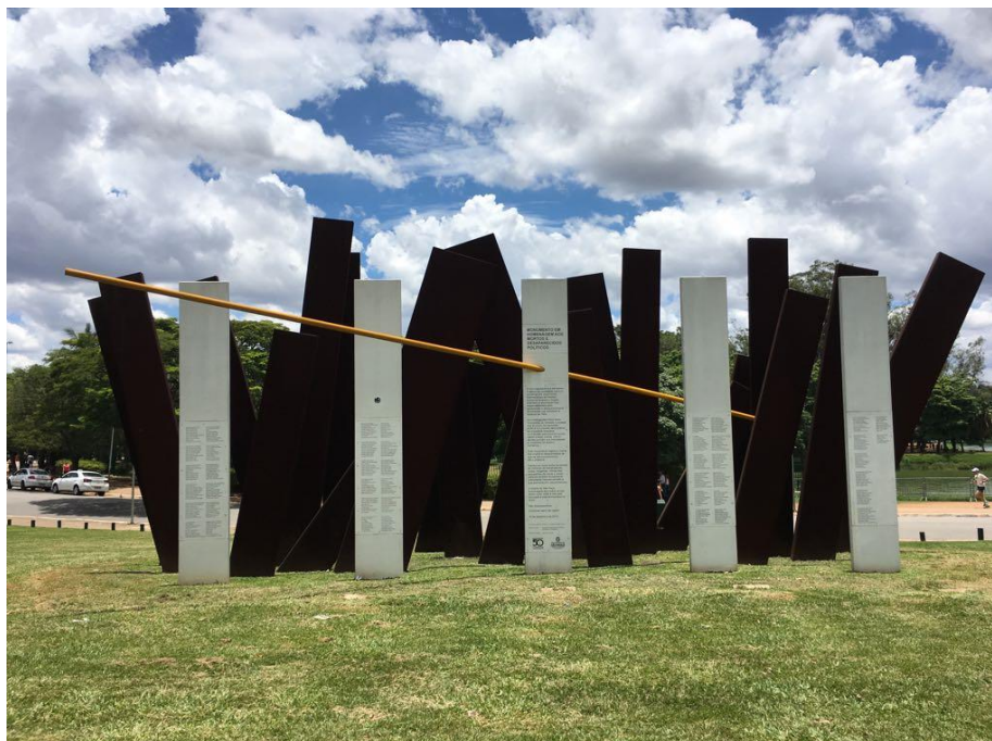
Figura 8: Monumento em Homenagem aos Mortos e Desaparecidos Políticos.

A gestão de Fernando Haddad foi responsável por outras ações de memória sobre o regime militar. O 3º Festival de Direitos Humanos, em 2015, – organizado pela Secretaria Municipal de Direitos Humanos – promoveu uma grafitação nos muros do Cemitério Dom Bosco, local da vala clandestina de Perus. As imagens tratavam sobre a história da ditadura e dos trabalhadores do bairro 66 . Em 2016, inaugurou o programa Ruas de Memória, “que pretende alterar progressivamente e de maneira participativa o nome de logradouros que homenageiam violadores de direitos humanos da ditadura militar 67 ” – o projeto, no entanto, foi